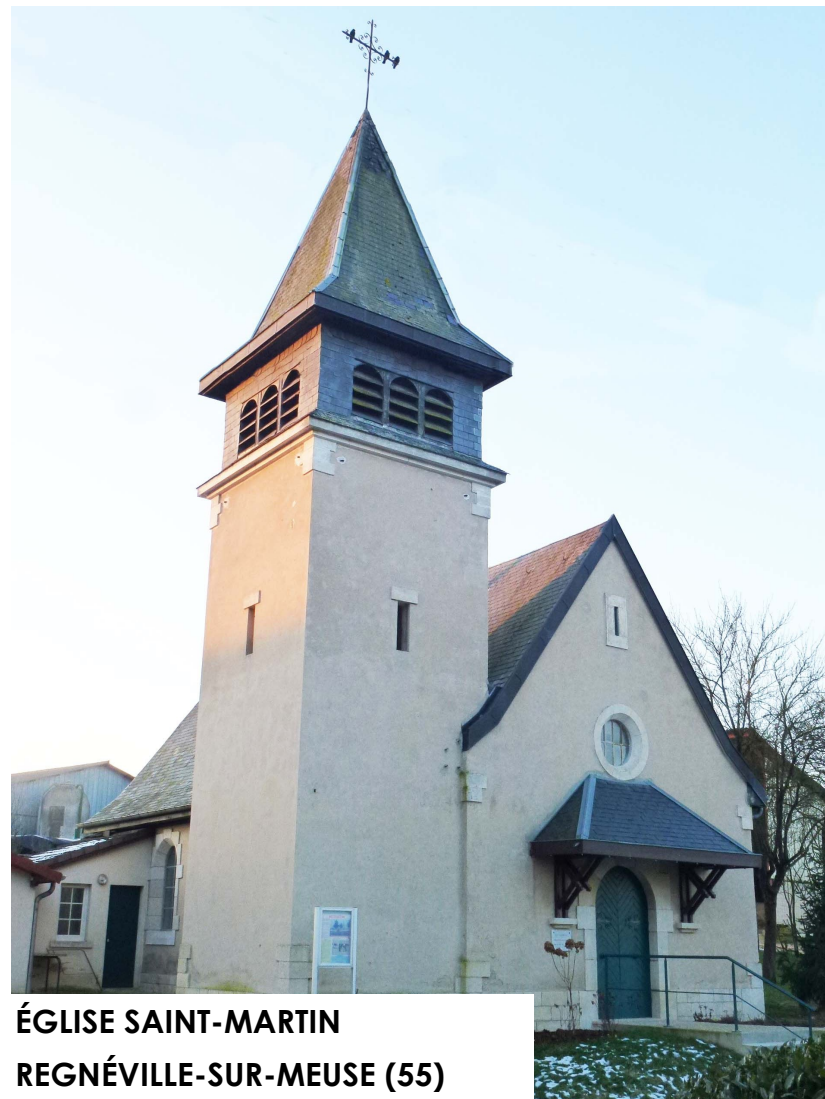
ÉGLISE SAINT-MARTIN REGNÉVILLE-SUR-MEUSE (55) Rue Charles Souhaut

Faites un don en ligne : www.fondation-patrimoine.org/32125